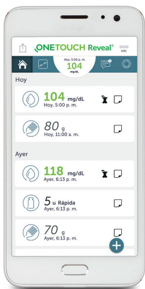
Línea de tiempo de eventos importantes