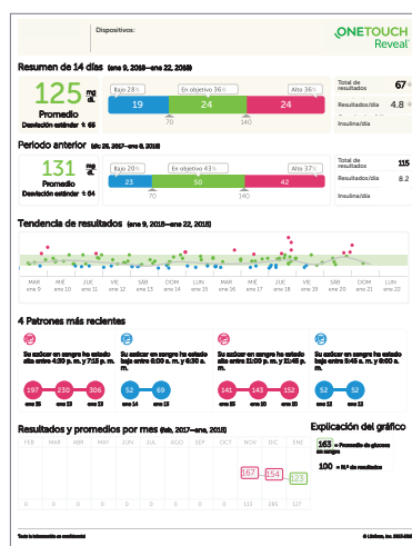
Vea y comparta informes de progreso