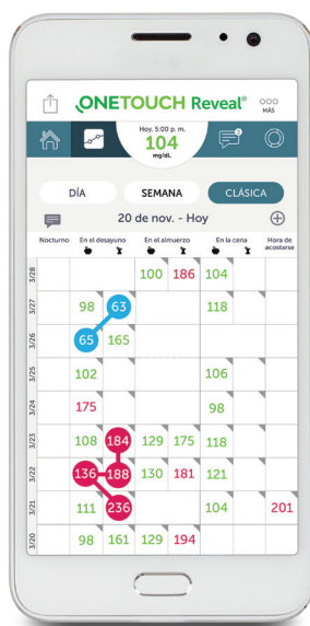
Libro de registro visual